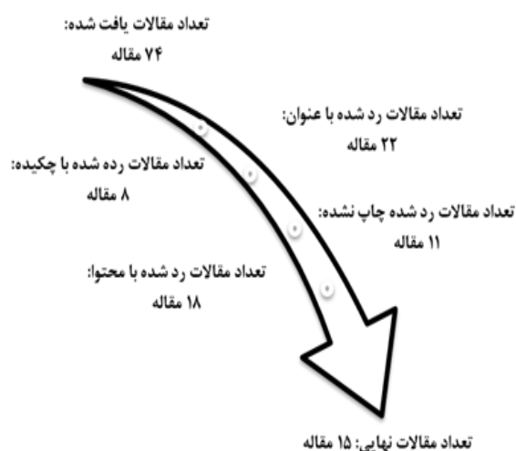
شکل ۲. مراحل انتخاب چک لیست نهایی مقالات

فرآیند پالایش و بازبینی با توجه به ملاک‌های ورود و خروج مذکور به طور اجمالی به شرح ذیل می‌باشد: