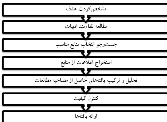
شکل ۱. روش هفت مرحله‌ای فراترکیب، ساندولوسکی و باروسو (۲۰۰۷)